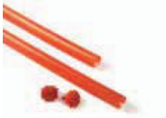
XBA13 listwy ochronne, gumowe, czerwone na ramię XBA 9x1 m 120,00 147,60 brutto