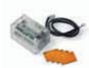
XBA7 moduł lampy sygnalizacyjnej kolor biały lub pomarańczowy do szlabanów BAR 175,00 215,25 brutto