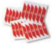
WA10 nalepki ostrzegawcze na ramię szlabanu (24 szt.) 80,00 98,40 brutto