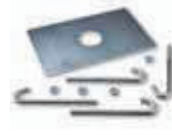
SIA1 płyta montażowa z kotwami 200,00 246,00 brutto