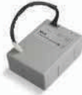
PS124 akumulator 24V 1.2 Ah z wbudowaną kartą ładowania 290,00 356,70 brutto