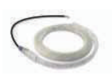
XBA4 diodowe światła ostrzegawcze 4 m 180,00 221,40 brutto