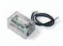
XBA8 moduł semaforów do szlabanów BAR 250,00 307,50 brutto