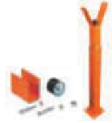
WA11 podpora ramienia stała, regulowana wysokość 250,00 307,50 brutto