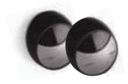
MOFB fotokomórki (para) BLUEBUS zasięg 15-30 m 190,00 233,70 brutto