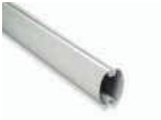
XBA19 ramię aluminiowe, owalne, 45x58x4000 mm 150,00 184,50 brutto